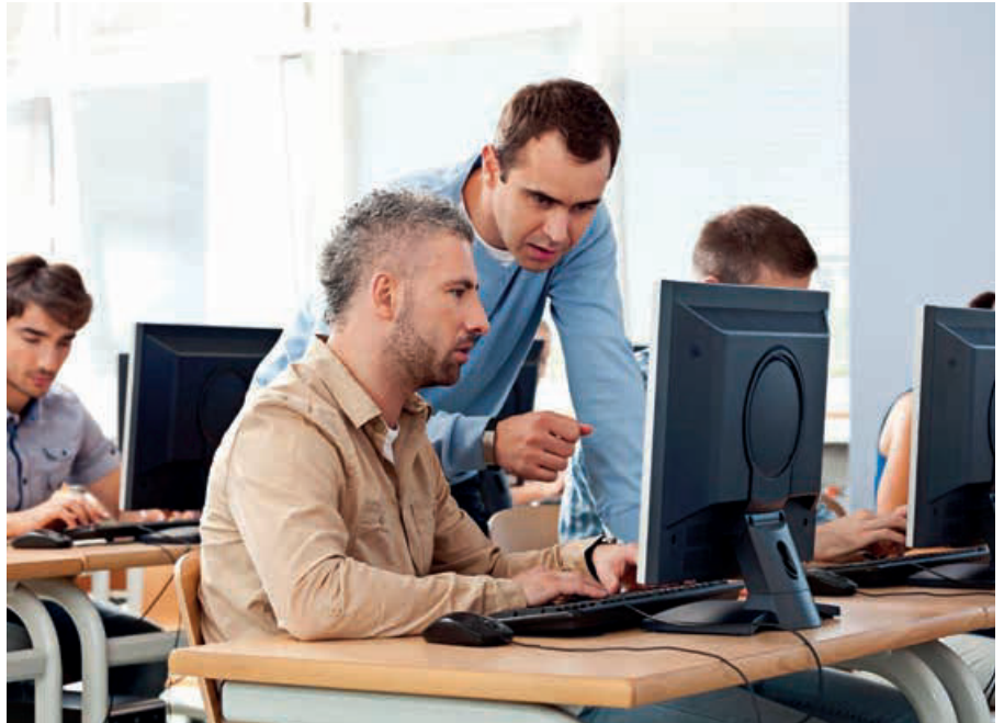
Man lernt nie aus – Wirtschaft 4.0 eröffnet viele neue Möglichkeiten

Ansatzpunkt des Projekts Cluster-KMU-Bildung 4.0 ist die betriebliche Aus- und Weiterbildung. Konkret werden den Auszubildenden Zusatzqualifikationen rund um Themen der Digitalisierung angeboten. Die Qualifizierung erfolgt im Verbund aus verschiedenen Unternehmen und Berufsschulen. Alle Angebote zielen darauf, bei den Auszubildenden Begeisterung für das Thema 4.0 zu wecken. Sie sollen bei der Gestaltung der Arbeitswelt von morgen miteinbezogen sein und somit zu Multiplikatoren des digitalen Wandels in ihren Betrieben werden.