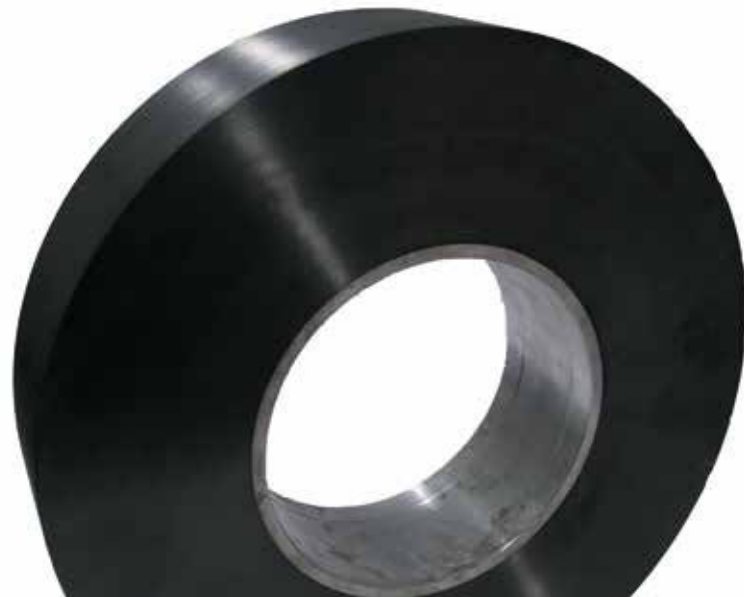
Abb. 2: Schleifscheibengrundkörper aus einem Wickelkörper mit Stahl liner

Das KVB Institut für Konstruktion und Verbundbauweisen hat in der Vergangenheit zahlreiche komplexe und dickwandige FVK-Strukturen entwickelt und realisiert, etwa Schleifscheibengrundkörper (Abb. 2), hochpräzise Traversen oder Laufrollen für einen Fahrzeugprüfstand. Hierbei konnten wertvolle Erfahrungen zum Temperaturabbau und zur Vermeidung lokaler Eigenspannungen bedingt durch den Fertigungsprozess gesammelt werden. Da sich die Auswahl eines geeigneten Matrixsystems in erster Linie nach den geforderten Eigenschaften des Endproduktes richtet, wurden und werden Herstellungsprozesse und Werkzeugkonstruktionen auf die jeweiligen bauteilspezifischen, lokalen Wärmeentwicklungen angepasst.