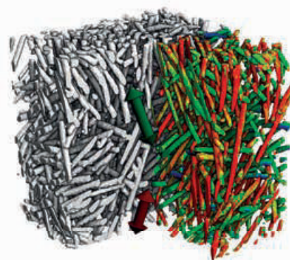
Faserorientierungsanalyse fiber orientation analysis