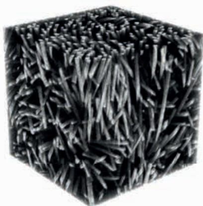
\mu CT-Scan \mu CT-scan