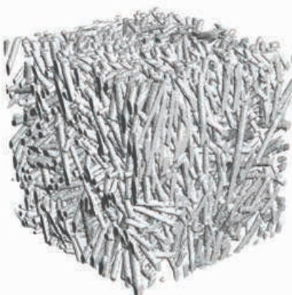
segmentierte Mikrostruktur segmented microstructure