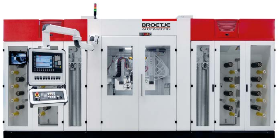
STAXX Compact 1700